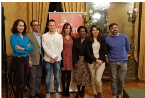
MDJ et pour ses professionnels.